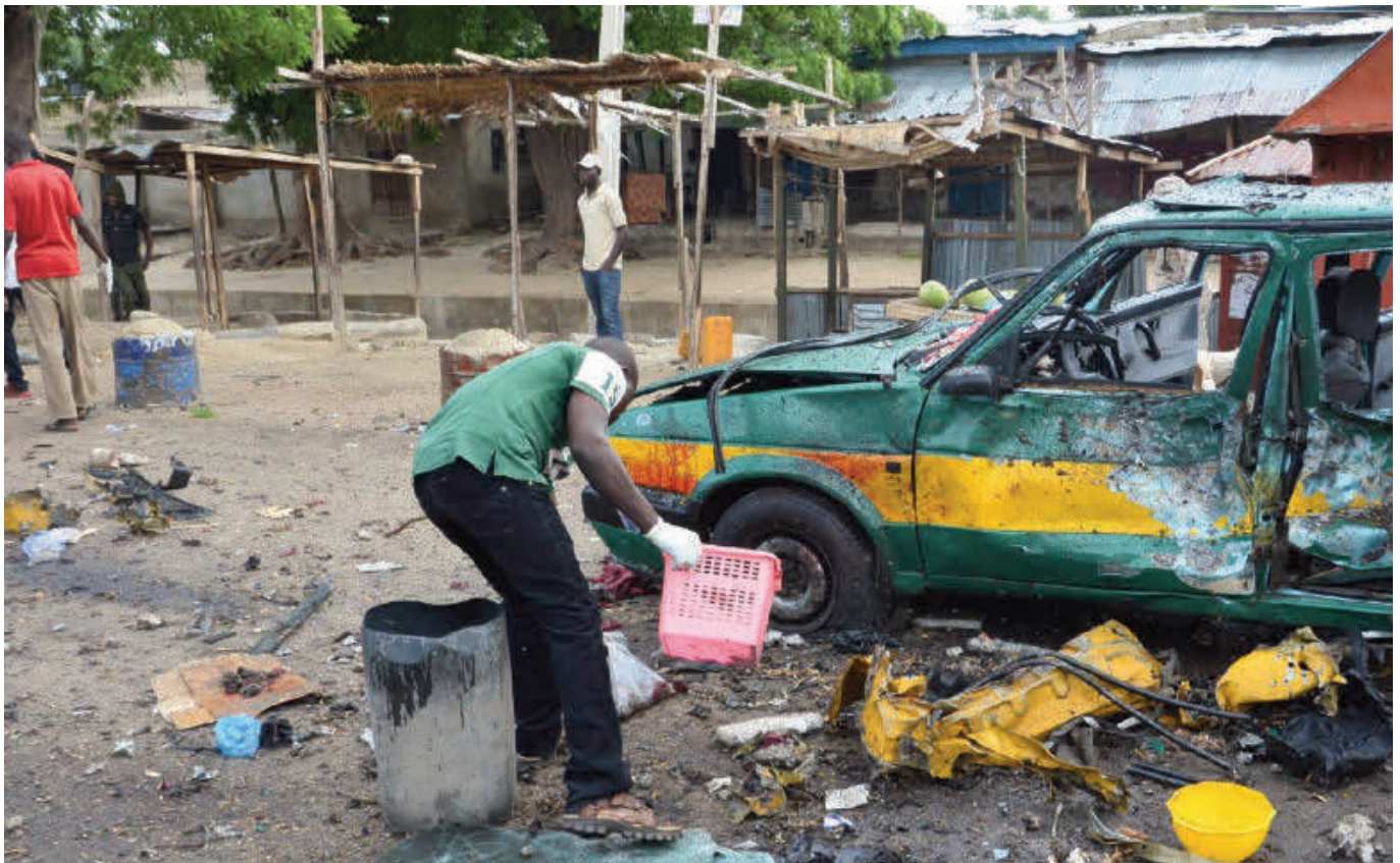
Nach einem Bombenanschlag von Boka Haram in Abudja.

Allerdings hält das die Regierung nicht davon ab, immer wieder den unmittelbar bevorstehenden Untergang von Boko Haram zu verkünden – mittlerweile hat wohl auch Abubakar Shekau, Anführer von Boko Haram, selbst den Überblick darüber verloren, wie