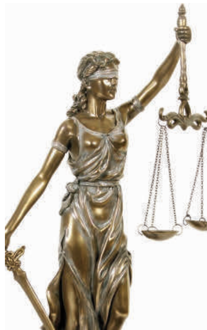
Die Gleichbehandlung von Straftätern vor Gericht - unabhängig ihrer Herkunft - ist unverzichtbar.