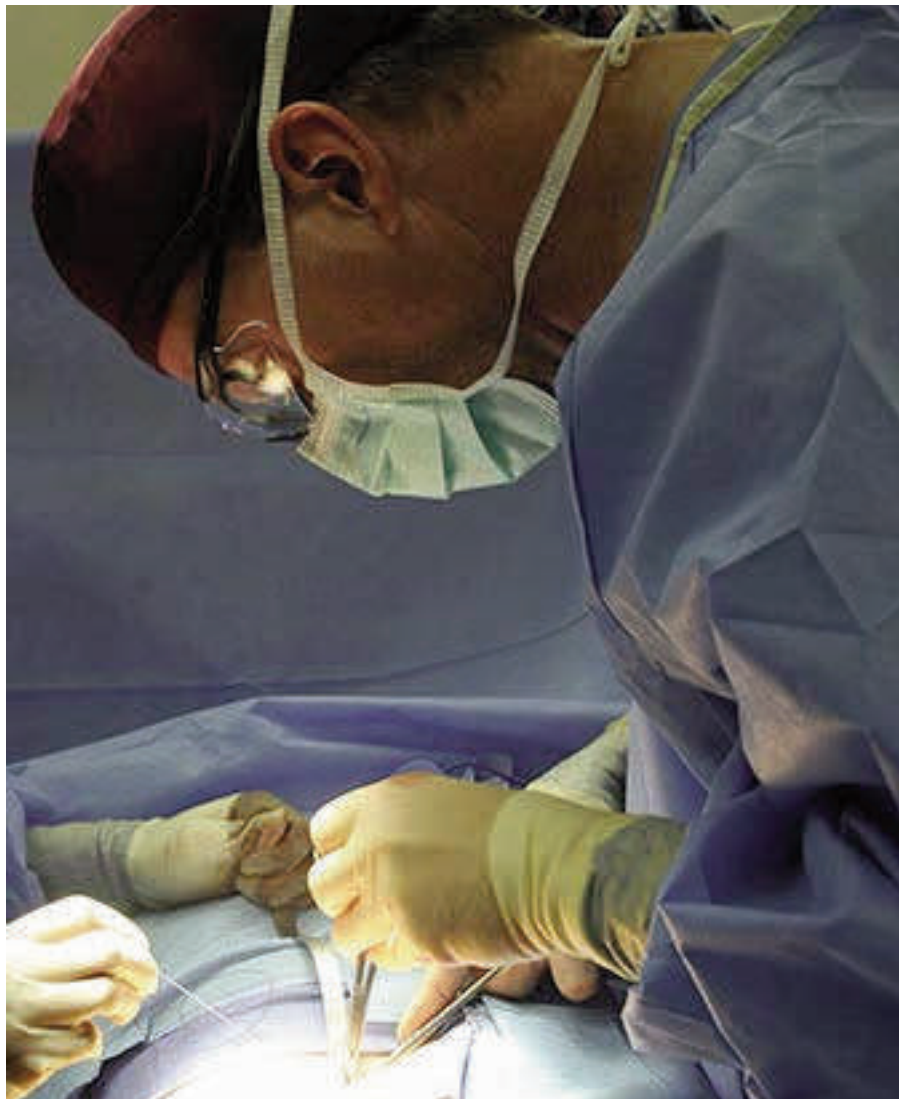
Woher stammen die Spenderorgane, die in der VR China transplantiert werden?

ter. Die bisherigen Erklärungsversuche chinesischer Stellen über die Herkunft der Organe sind völlig unplausibel. Es besteht in China kulturell bedingt eine Aversion gegen Organspenden und daher gibt es kaum freiwillige Spender. Zudem fehlt ein effektives Datenbank- und Verteilsystem wie es z. B. in Europa existiert. Bei behaupteten Reformen in der Transplantationsregulierung verweigerten die chinesischen Stellen nach wie vor Informationen und jede Überprüfung, so die IGFM.