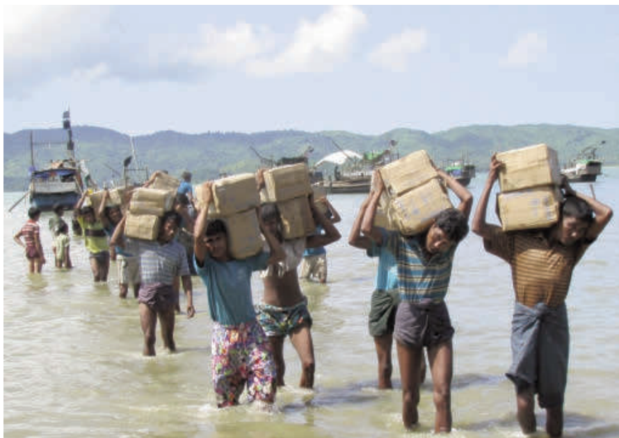
Wenig Hoffnung für Rohingya-Flüchtlinge aus Myanmar (Burma). Bild: Mathias Eick, EU/ECHO, Rakhine State, Myanmar/Burma, September 2013.

Fast 90 Prozent der 53 Millionen Einwohner Myanmars sind Buddhisten. Religiöse Minderheiten wie die christlichen Kachin, die Karen, und vor allem die muslimischen Rohingyas, werden seit Jahrzehnten brutal verfolgt. Obgleich es in Myanmar über hundert weitgehend anerkannte ethnische Minderheiten gibt und obwohl diese muslimische Gruppe seit Jahrhunderten in Myanmar angesiedelt ist, werden die Rohingyas nicht als Bürger Myanmars angesehen oder anerkannt. Durch ein Gesetz von 1982 ist ihnen die sogenannte Staatsbürgerschaft von „Nicht-Einheimischen“, wozu die Rohingyas nach Ansicht des Staates gehören, verwehrt worden. Seitdem hat der Einfluss von ultra-nationalistischen buddhistischen Extremisten sowie religiöse Intoleranz und Anstiftung zu Hass gegen die Rohin-