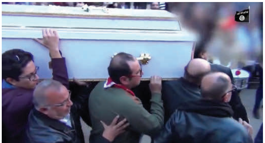
Mahmoud Shafiq sprengte sich am 11. Dezember 2016 während eines Gottesdienstes in der St.-Peter-und-Paul-Kirche in Kairo in die Luft. Er tötete 29 Menschen – überwiegend Frauen und Kinder – und verletzte über 40 weitere, zum Teil schwer. Die Kirche liegt unmittelbar neben der Kathedrale von Kairo, dem Symbol des christlichen Ägyptens. In der ägyptischen Öffentlichkeit wird die Radikalisierung durch die Haftbedingungen immer deutlicher wahrgenommen.

hatte dramatische Folgen. Bei seiner Freilassung war der junge Mann nicht mehr derselbe. Er tauchte unter und schloss sich dem „Islamischen Staat“ an. Was die Ideologie der Islamisten vorher nicht geschafft hatte, erreichten Willkür und Folter des ägyptischen