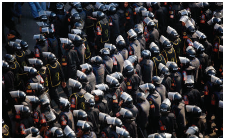
Ägyptische Sicherheitskräfte, vor einer Kundgebung für bürgerliche Rechte.