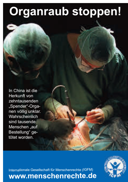
Dieses Flugblatt zum Thema Organraub kann bei der IGFM kostenlos bestellt werden.

dass die in der VR China transplantierten Organe ausschließlich von freiwilligen Spendern stammen. Darüber hinaus darf es keine Kostenübernahme durch deutsche und europäische Krankenversicherungen für Kosten im Zusammenhang mit Transplantationen in der Volksrepublik China geben. Ebenso wichtig seien gesetzliche Regelungen, die verhindern, dass deutsche und europäische Patienten am „Transplantationstourismus“ in der Volksrepublik China teilnehmen.