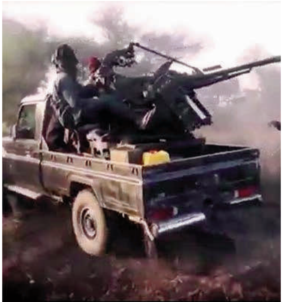
Die islamistische Terrorarmee „Boko Haram“ sorgt in Nigeria noch immer für Angst und Schrecken.

Bereits 1967 hatte sich der Südosten des Landes unter dem Namen Biafra von Nigeria losgesagt und wurde in einem zweieinhalb Jahre andauernden brutalen Bürgerkrieg gewaltsam zurückerobert.