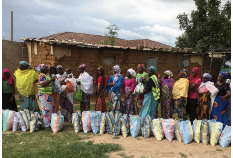
Christliche Flüchtlinge, die dem Terror von Boko Haram entkommen konnten.

Dennoch ist Al Shabaab nach wie vor eindeutig auch eine Terror-Organisation – doch wo Boko Haram auch aus den Reihen moderaterer Muslime (und fast alle Muslime sind verglichen mit Boko Haram als „moderater“ zu bezeichnen), selbst von Salafisten und erzkonservativen saudi-arabischen Gelehrten, harsche Kritik für ihr willkürliches und hemmungsloses Blutvergießen erfahren, besteht die Opposition von Al Shabaab vor allem aus der somalischen Regierung (der provisorischen Übergangsregierung) und dem überwiegend christlich geprägten