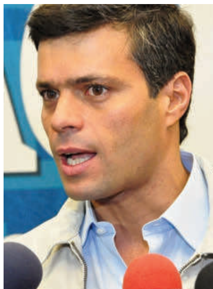
Nach internationalen Protesten aus der Haft in den „Hausarrest“ entlassen: Leopoldo López.

ab, dass für das Maduro-Lager ideologische Prämissen Vorrang haben gegenüber den allgemeinen Menschenrechten, wie Meinungs- und Versammlungsfreiheit. Wie einst beim Völkermord in Ruanda scheint die Weltöffentlichkeit bei der schleichenden Umgestaltung Venezuelas in ein diktatori-