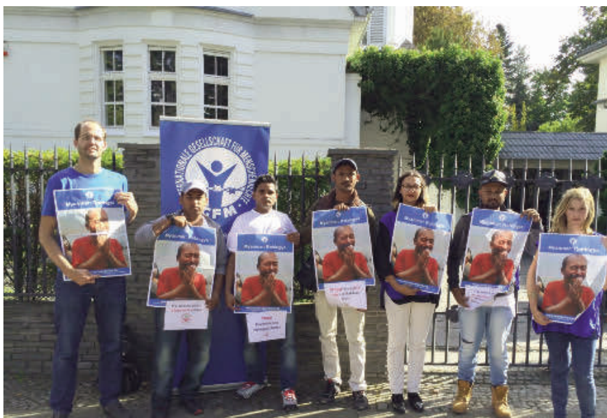
IGFM-Mahnwache für Rohingyas.