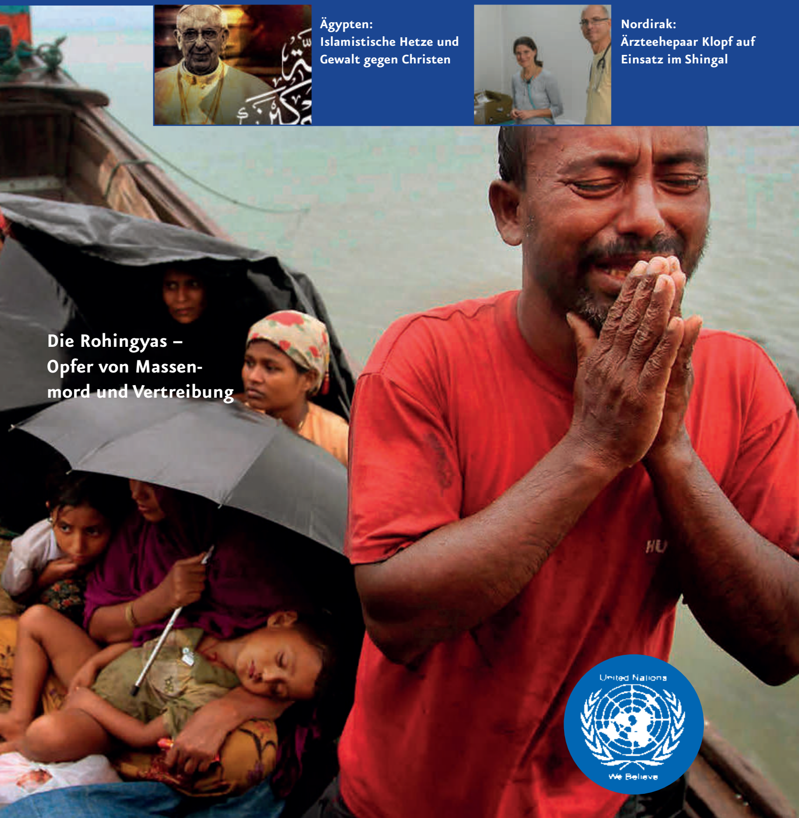
Die Rohingya – Opfer von Massen- mord und Vertreibung