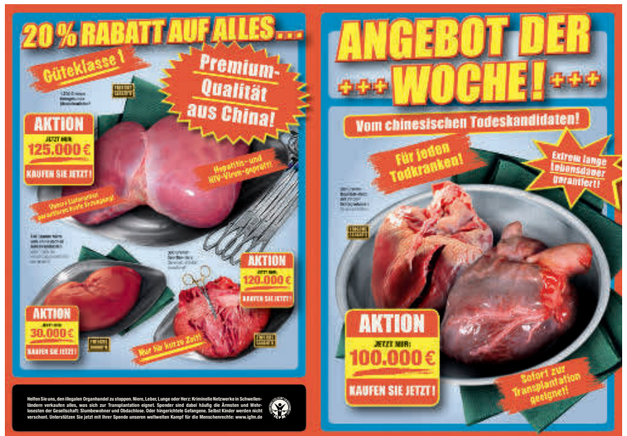
Aktion der IGFM gegen Organraub. „Zeitungsbeilage“ informiert über fragwürdige Praktiken in der chinesischen Transplantationsmedizin.

Die IGFM fordert aus diesem Grund ein rasches Handeln der internationalen Staatengemeinschaft. Notwendig sei eine internationale Untersuchungskommission, um die Herkunft zehntausender Spenderorgane und die mutmaßliche Ermordung tausender politischer Gefangener zu klären.