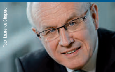
Schirmherr und Referent: Volker Kauder Fraktionsvorsitzender der CDU/CSU im Bundestag