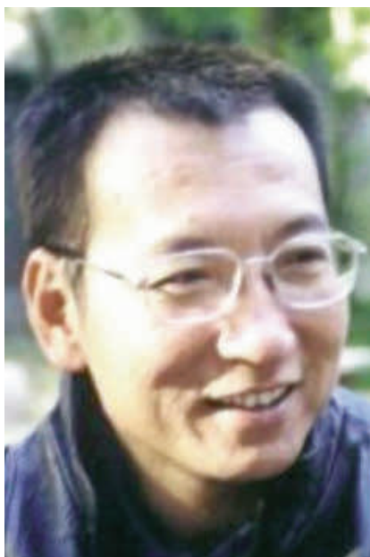
Friedensnobelpreisträger Liu Xiaobo starb in einer chinesischen Klinik an Krebs.

Die Machthaber in Peking sind gegenüber Deutschland und Europa bemüht, sich als verlässlicher und vertrauenswürdiger Partner darzustellen. Das „moderne“ China des Präsidenten Xi tritt dem-