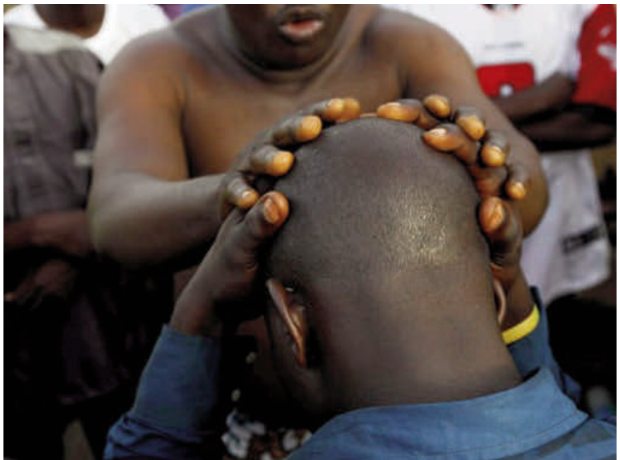
Männer ohne Kopfbehaarung werden von Hexendoktoren in ostafrikanischen Staaten als Träger magischer Kräfte angesehen.

Der Aberglaube schreibt Albinos magische Kräfte zu, welche die Hexendok-