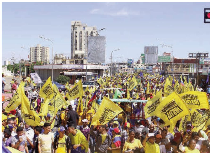
Demonstration gegen die Maduro-Regierung.

Mit der gezielten Besetzung von Richter- und Verwaltungsposten mit Parteigängern der Maduro-Regierung wurde das Parlament faktisch kalt gestellt, so dass nurmehr der Protest auf der Straße bleibt, dem sich immer mehr Bürger anschließen. Immer mehr zeichnet sich