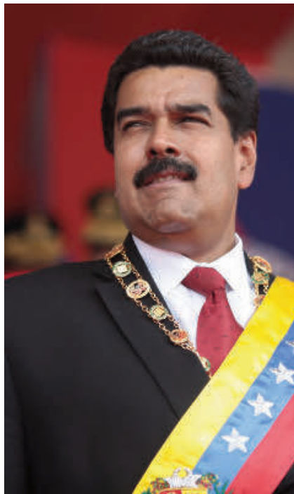
Präsident Nicolás Maduro möchte eine neue Verfassung.