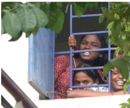
Im Waisenhaus eingesperrte Mädchen

In Indien werden Christen weniger stark verfolgt als in den muslimischen Ländern, dennoch wird das Klima rauer. Dafür verantwortlich ist zum einen die rasante Ausbreitung des Evangeliums, die manchen Leuten Angst macht, andererseits die politische Situation. Die indische Regierung selbst gibt sich als tolerant, die Verfolgung selbst besteht darin, dass bei Übergriffen gegen Christen nicht die Täter selbst, sondern die Opfer verfolgt oder in Haft genommen werden. Solche Übergriffe sind an der Tagesordnung. Während wir