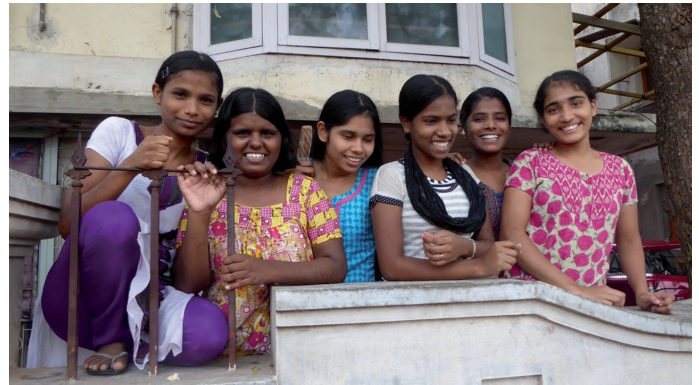
Die Mädchen lächeln, obwohl sie in dem Haus festsitzen

Ich dachte mir so: Bei uns ist das Schlimmste, was einem als Christ passieren kann, gemobbt oder medial geächtet zu werden. Und ich spreche zu Pastoren, die buchstäblich die Sicherheit ihrer Familie und ihr eigenes Leben aufs Spiel