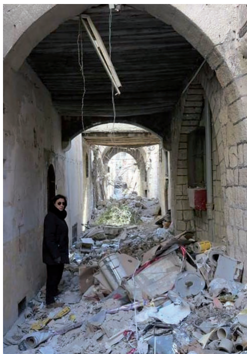
Einkaufspassage Souks in Aleppo vor und nach dem Angriff islamistischer Rebellen